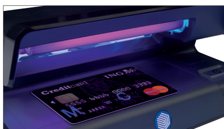
Prüft die UV-Merkmale von Kreditkarten