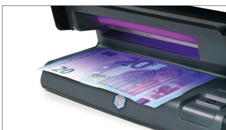
Prüft die UV-Merkmale von Banknoten