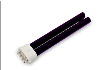
Safescan 50 / 70 UV-Lampe